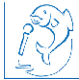
Stichting Vlaardings Songfestival