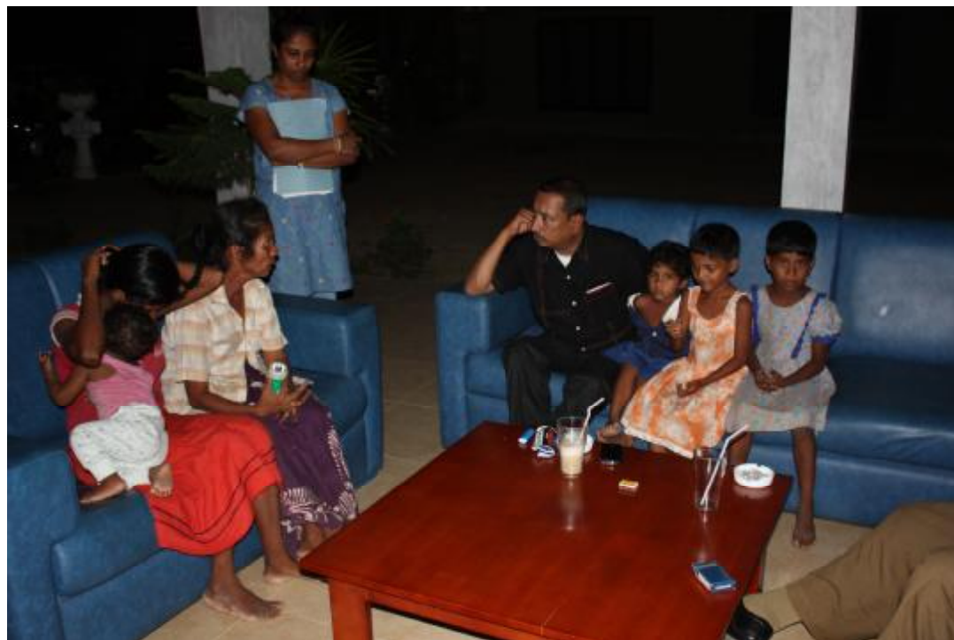
O.a. zijn deze kinderen door jullie gered.